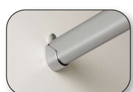
Kleiderstange und Stangenträger aus Metall