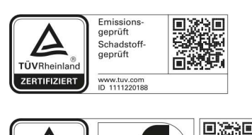
Die Garantebestimmungen finden Sie auf unserer Website www.jutzler.swiss