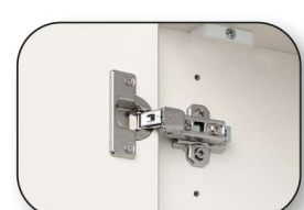
Metallscharniere bei allen Drehüren