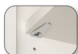
Verschraubbare Metallträger bei Einlegeböden mit Höhe 22 mm