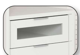
Glasteile aus Sicherheitsglas