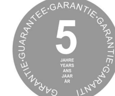
Die Garantebestimmungen finden Sie auf unserer Website www.jutzler.swiss