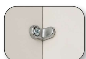
Rückwandhalterung aus Metall