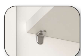
Metallwinkelträger bei Einlegeböden mit Höhe 16 mm